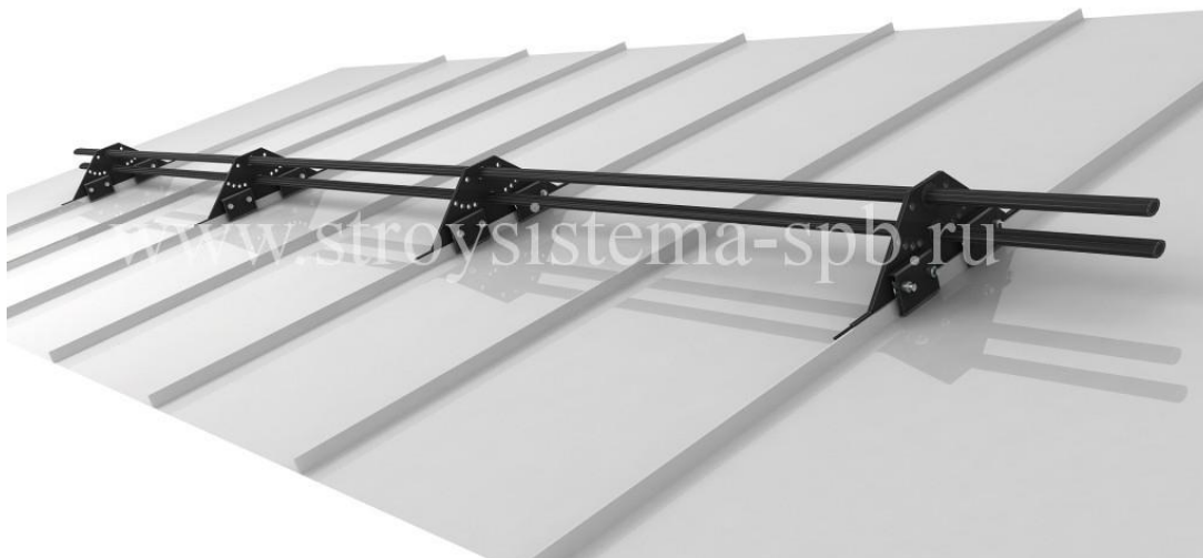
Пример. Трубчатый снегозадержатель «FISHER»