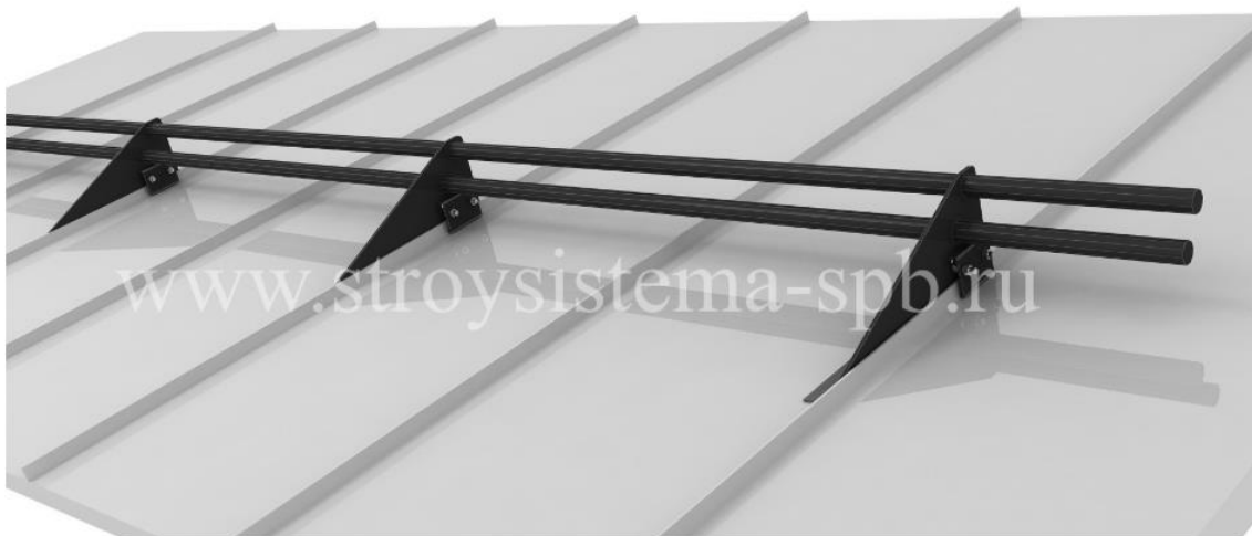
Пример. Трубчатый снегозадержатель «FISHER»